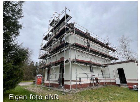
Eigen foto dNR

De renovatie van de voormalige apothekerswoning aan de Hoofdweg 150 is in volle gang. Het huis is aan de buitenkant gereinigd en ziet er weer als nieuw uit. Het plan is om dit pand aan te bieden in de verhuur. Mocht je interesse hebben, laat het ons dan weten via hallo@nieuwe-rentmeester.nl