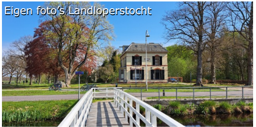
Eigen foto's Landloperstocht

Tijdens de wandeling kun je genieten van al het moois dat het Unesco Wereld Erfgoed dorp Veenhuizen te bieden heeft. Daarnaast gaat een deel van de route over het bijzondere Fochteloërveen.