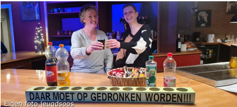
Eigen foto jeugdsoos

Voor de jeugdsoos in Veenhuizen zijn wij op zoek naar extra vrijwilligers! Wij zijn een gezellige club ouders die ons willen inzetten voor de jeugdsoos zodat die kan blijven bestaan voor onze jeugd. Echter hebben we wel meer ouders nodig zodat we dit initiatief met elkaar kunnen dragen en onze kinderen daar nog lang plezier van mogen ervaren. De jeugdsoos is iedere vrijdag van 19.00 tot 21.30/22.00 uur in het verenigingsgebouw.