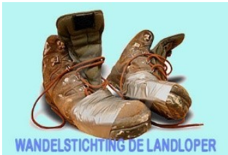
WANDELSTICHTING DE LANDLOPER

Om bekendheid te geven aan deze tocht is toen een stichting opgericht en hebben we ons aangesloten bij de Nederlandse wandelbond. Op die manier bereikten we niet alleen de regionale wandelaars, maar ook liefhebbers elders. We hebben lopers gehad uit bijna alle provincies. Iedereen hebben we kennis laten maken met de bosrijke omgeving, het Fochteloërveen en natuurlijk ook het dorp zelf met alle historische panden.