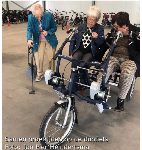
Samen proefrijden op de duofiets

Maar dit is nog niet alles. Ook het Burenblad kan ook op veel sympathie en erkenning rekenen. Niet alleen van de fondsen maar vooral ook uit het dorp. We hebben ook deze maand weer veel donaties mogen ontvangen. Echt hartverwarmend! Heel veel dank daarvoor. Daarnaast willen we WIN , de provincie Drenthe en Rabobank Noordenveld West Groningen ook heel hartelijk danken voor hun schenkingen. Dankzij jullie kunnen we nu het Burenblad op fijne en betrouwbare apparatuur afdrukken en blijft Veenhuizen ook in de toekomst van het dorpskrantje verzekerd.