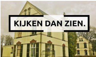
Hedendaagse kunst op bijzondere locaties in Veenhuizen

Veenhuizen bestaat als voormalige kolonie van de Maatschappij van Weldadigheid 200 jaar. In dat kader worden er diverse evenementen georganiseerd waaronder Kijken dan Zien . Een wandel- of fietsroute van ongeveer 4 km langs bijzondere locaties, waar beeldend werk te zien is van zes kunstenaars uit Drenthe, Brabant, Noord-Holland en Overijssel.