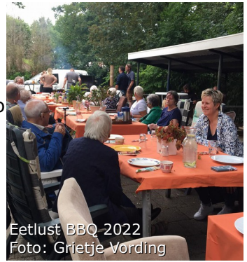
Eetlust BBQ 2022

Op maandag 28 augustus kunnen we weer van de grillkunsten van topkok Marco Philips genieten. Dan vindt namelijk weer de jaarlijkse Eetlust BBQ plaats. En dit is geen sinecure. Marco bereidt het vlees ter plekke op een zeer speciale barbecue. En verder zal hij een ruim assortiment aan groenten en vers bereide salades meenemen. Wil je ook aanschuiven? Meld je dan aan door ons een mailtje te sturen. De kosten zijn € 17,50 per persoon en dit is inclusief twee drankjes.