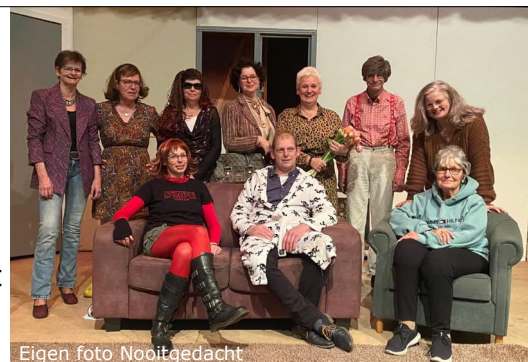
Nooitgedacht